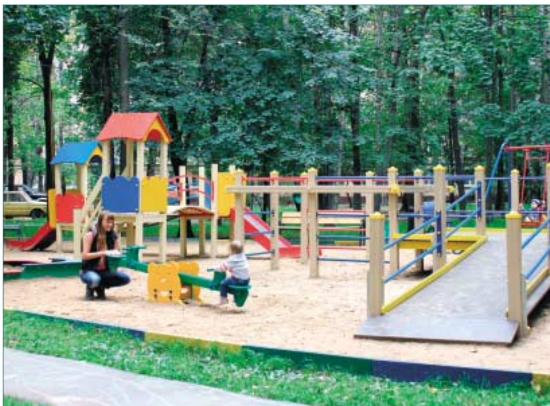
Междворовый игровой комплекс по адресу: Сиреневый бульвар, д. 43-а.